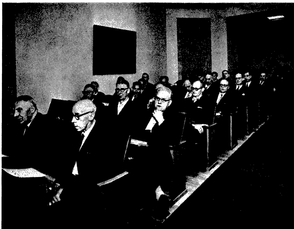
Gruppbild av deltagarna i årsmötet.

bilkostnader och förmåner av bil” med redogörelse bl. a. för senare utslag i regeringsrätten i dessa hänseenden. Föredraget kommer att införas i Skattenytt.