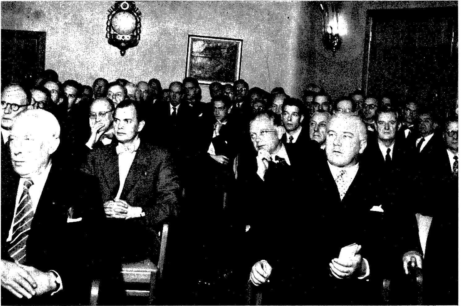
En del av deltagarna i årsmötet under statsrådet Skölds föredrag.