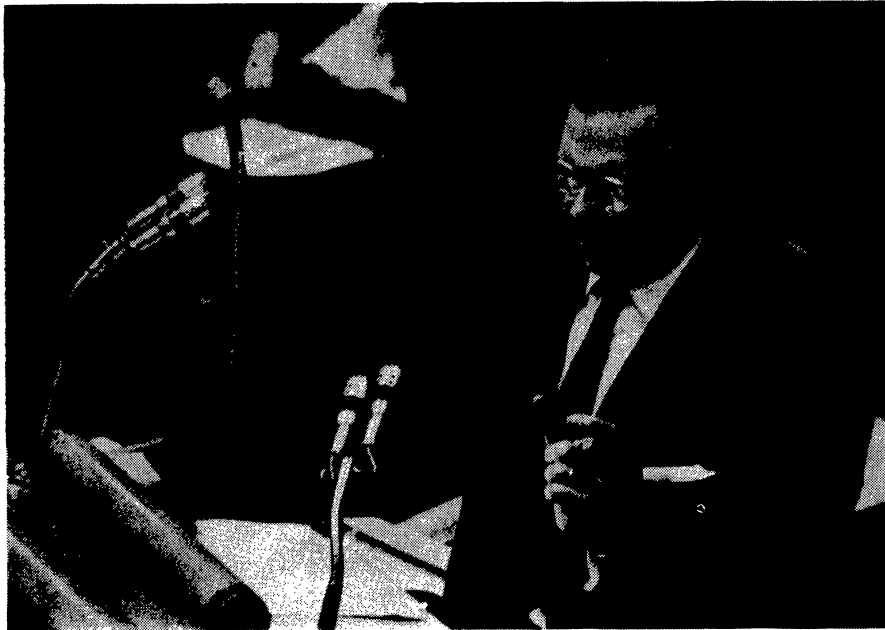
Finansminister Gunnar Sträng