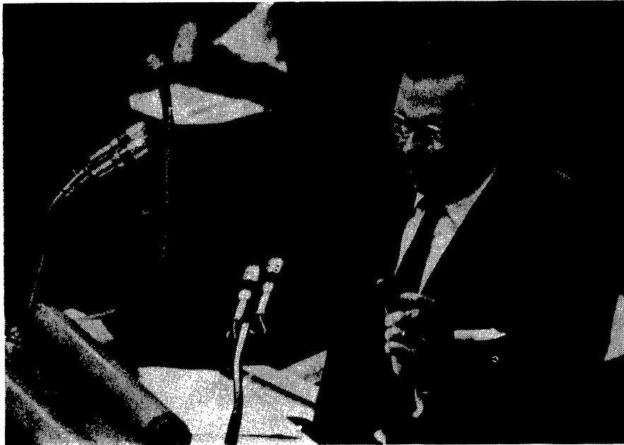
Finansminister Gunnar Sträng