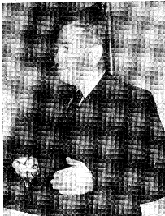
Finansministern Statsrådet Per Edvin Sköld.